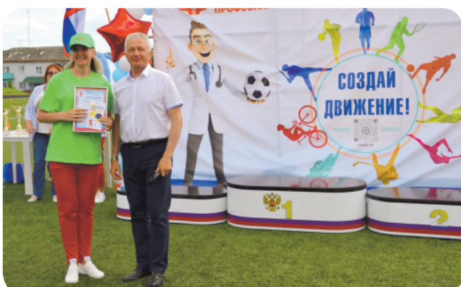
Награждение команды «Искорка»