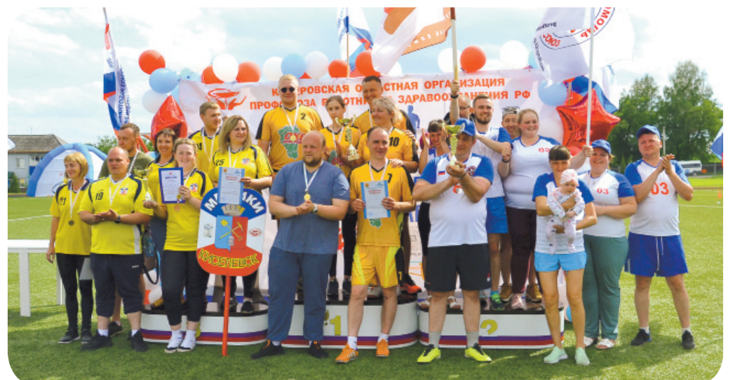
Команды, занявшие 1-3 места