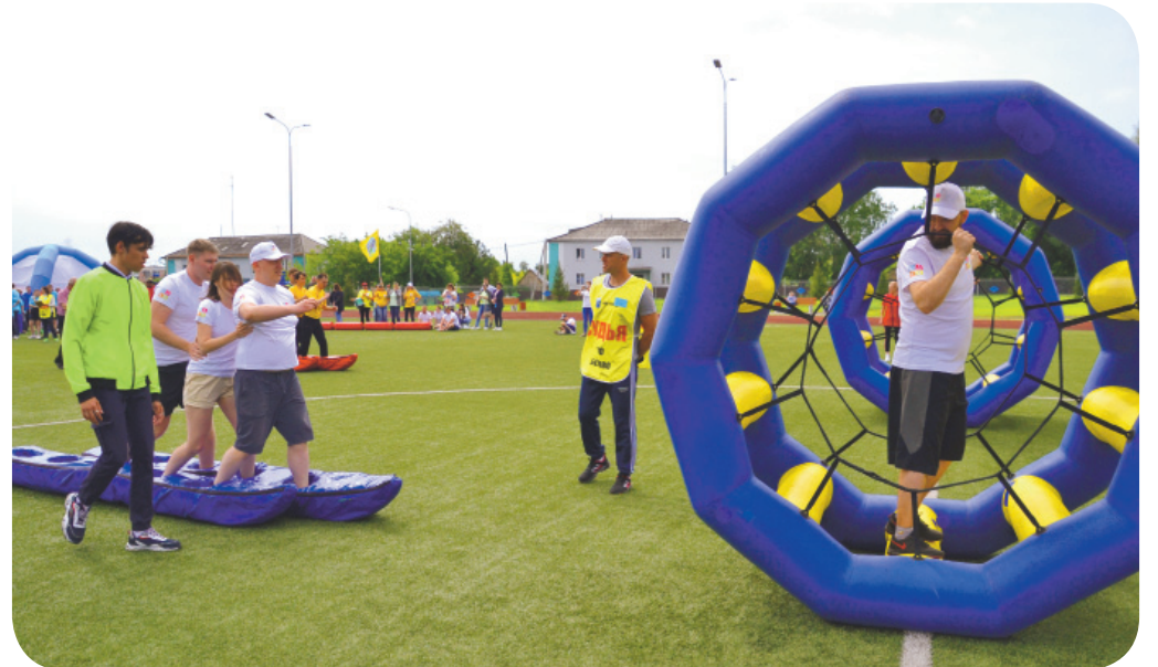
Эстафета – хорошая проверка команды на слаженность действий

В итоге в общекомандном зачёте лучшей заслуженно стала команда Кузбасской областной клинической больницы имени Беляева, которая победила сразу в трёх испытаниях. На втором месте – Кеме-