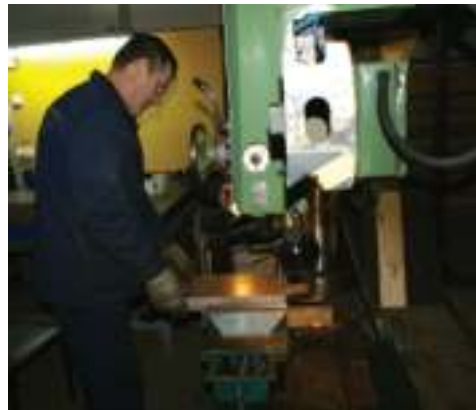
На новом оборудовании и работать приятно