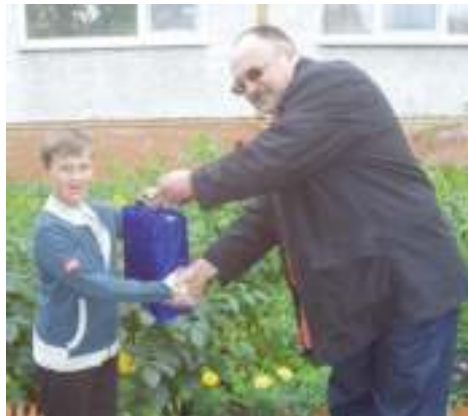
Председатель профкома вручает школьникам подарки к 1 сентября

Основной «работодатель» для ЗАО «Кемероволифтсервис» – квартиросъемщики: предприятие занимается монтажом, сервисным обслуживанием и демонтажом лифтов. В прошлом году в связи с известными процессами в мировой экономике резко упали сборы. Несмотря на сложную ситуацию, людей не только не сокращают, но, наоборот, собираются дополнительно принимать еще 40 человек. Кстати, нет на предприятии и текучести кадров. Высококвалифицированным специалистам администрация предоставляет возможность дополнительного заработ-